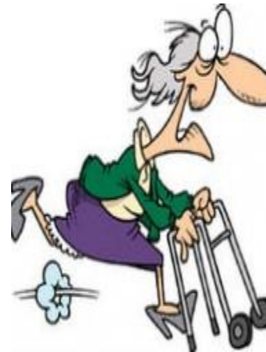
Bewegen me hulpmiddel